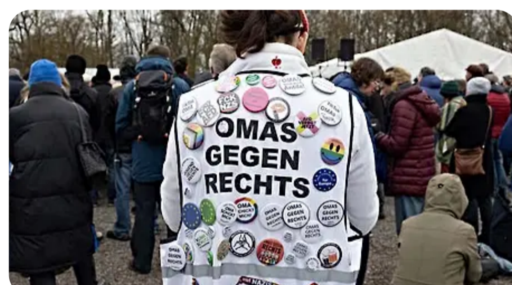
Schüler werden zu Veranstaltung der Omas gegen Rechts verpflichtet jungefreiheit.de