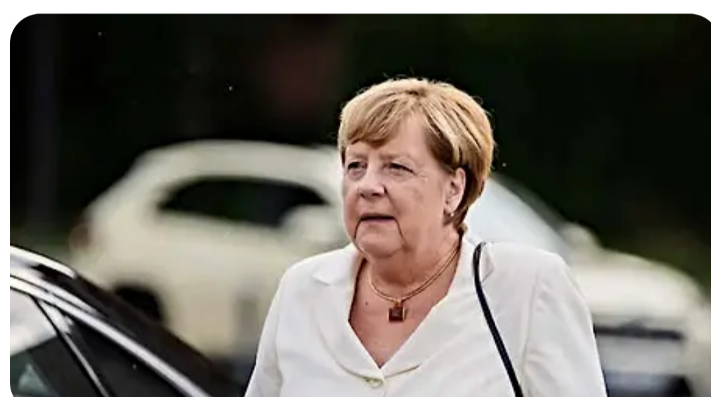
Was den Steuerzahler Merkels Frisur bis heute kostet jungefreiheit.de